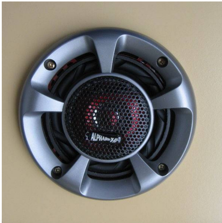
Abbildung 3: Lautsprecher eingebaut von vorn