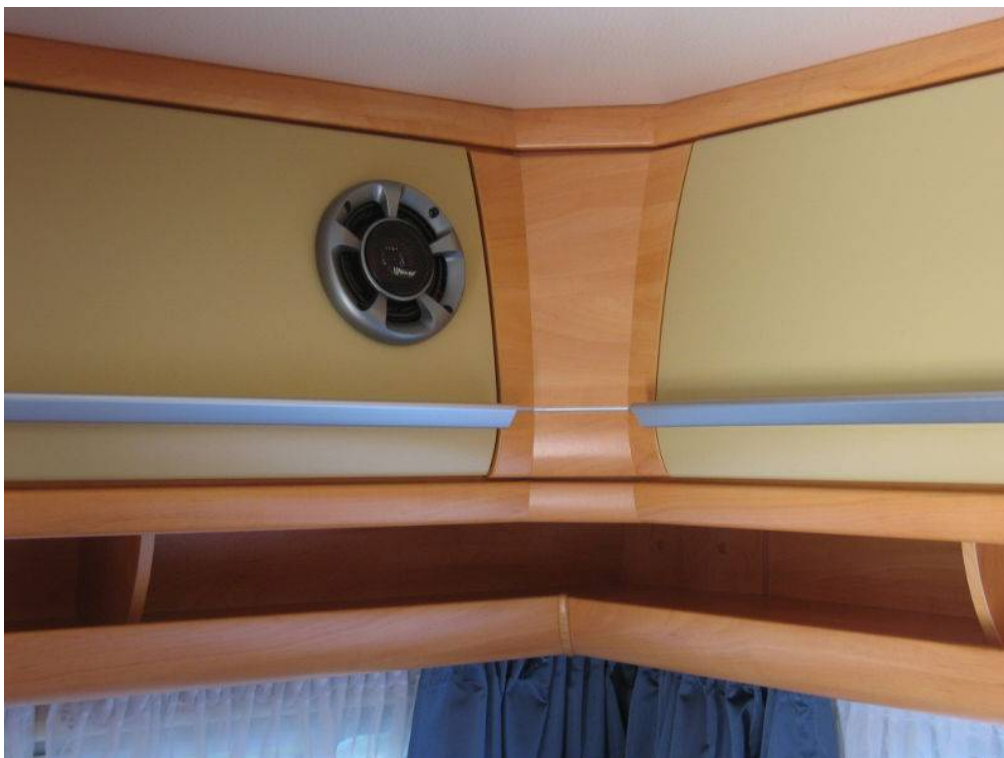
Abbildung 4: Klappe wieder eingebaut im Wohnwagen